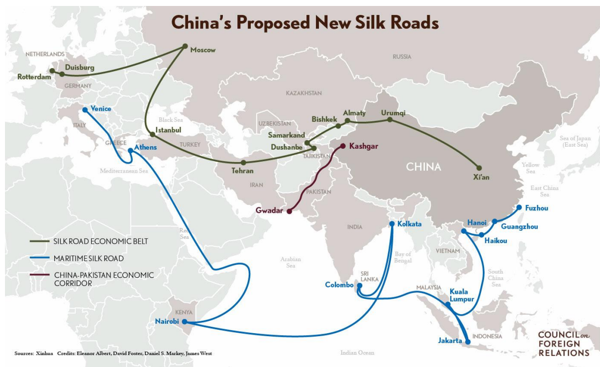
图 1 中国倡议的新丝绸之路

廊背后的地缘战略动机，但很多评论家指出，长期来看经巴基斯坦到阿拉伯海的陆路将有助缓解“马六甲困境(Malacca dilemma)”。这是中国的一个弱点，大约 85% 的石油进口要通过马六甲海峡这一“咽喉要道”。